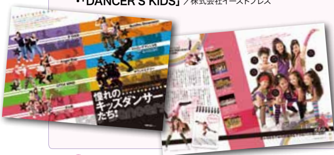
← DANCER'S KiDS 新規雑誌立ち上げにあたり、冊子内の1/2以上の企画編集をjust-Beにて担当。