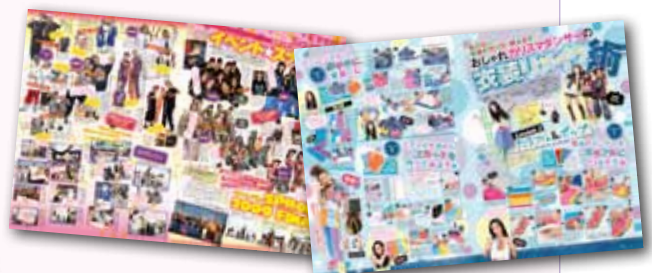
↑ DANCE STYLE KiDS 立ち上げ以来、主力編集プロダクションとして、ダンスシーンに密着したさまざまな企画を担当。