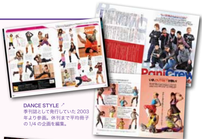
↑ DANCE STYLE 季刊誌として発行していた2003年より参画。休刊まで平均冊子の1/4の企画を編集。