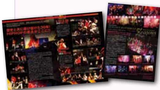
↑ DANCE DELIGHT 2006年より、関東方面のイベントレポート記事の編集・デザインを不定期で担当。