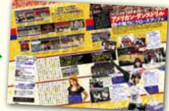
↑主催イベントのPR記事を掲載。