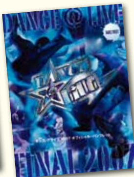
ダンスイベントパンフレット： DANCE@LIVE 様