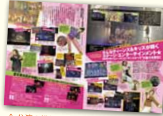
↑公演の様態を見開きページでレポート。