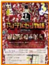
1ページの純広告を出稿。