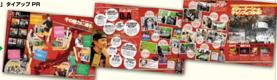
↑イベントの裏側レポート、講師や生徒とのインタビューなどを6ページにわたって掲載。