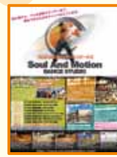
1ページのスクール広告を出稿。