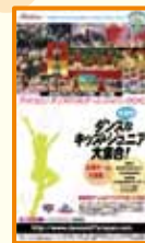
1ページのオーディション広告を出稿。