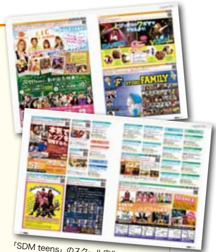
「SDM teens」のスクール広告ページ

※掲載数が想定以上に多い場合、関東圏、関西圏、名古屋圏だけに限らせて頂く場合がございます。予めご了承下さい。