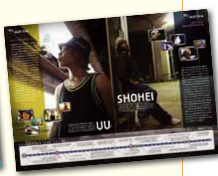
ダンス公演パンフレット： WRECKING CREW ORCHESTRA 様