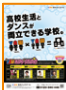
1ページの純広告を出稿。