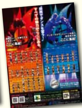
ダンススクール広告： STUDIO A-Sh 様