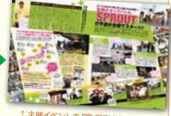
↑主催イベントのPR記事を掲載。