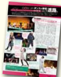
↑発表会レポートを掲載。