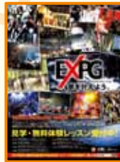
1ページの純広告を出稿。