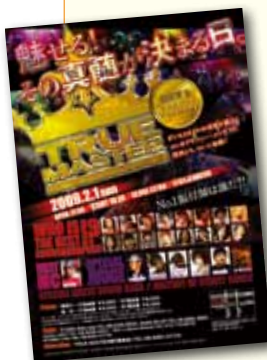
ダンスイベント広告： TRUE MASTER 様