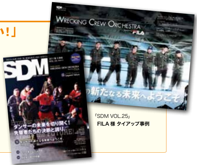
「SDM VOL.25」 FILA 様 タイアップ事例

そこで、シーン随一のフリーマガジンの表紙に、カリスマ・ダンサーが御社ブランドを身につけて表紙に掲載。表紙モデルには御社のご要望の応じた、シーンの人気ダンサーをピックアップ。シーンの事情に精通した弊社だからこそ出来る、認知度・影響力・売り上げに大きく貢献できるPRと確信しております。